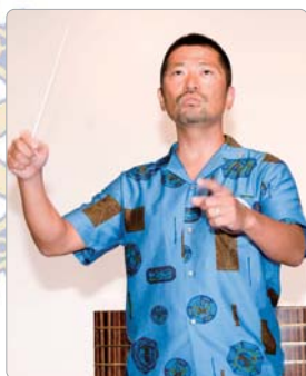
天方ソングリーダー