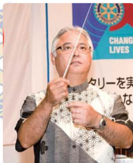
上原ソングリーダー