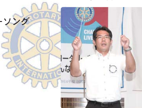
仲間ソングリーダー