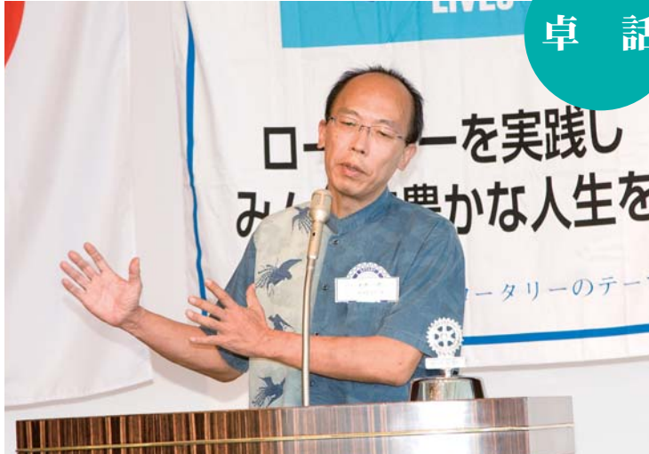
既存の出版本と電子書籍の市場がやがて逆転することになるよ予想